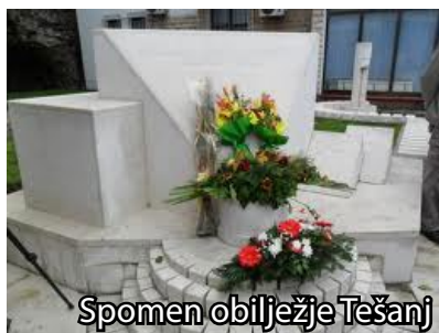
Spomen obilježje Tešanj